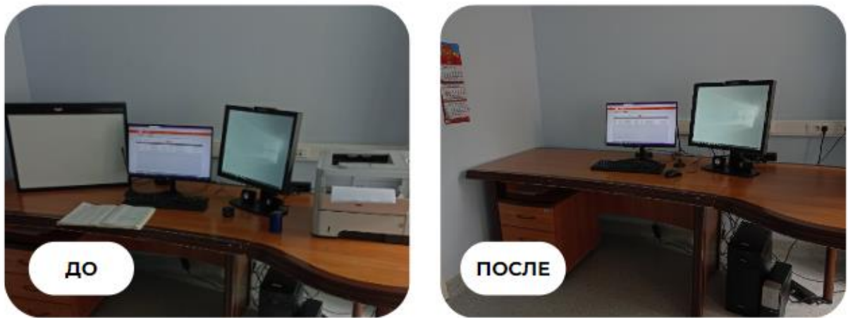
Рисунок 5. Пример кабинета врача рентгенолога до и после внедрения стандарта

8. Оснащение кабинета врачей рентгенэндоваскулярной диагностики и лечения, врачей рентгенологов, рентгенолаборантов, использующих устройства голосового ввода при описании исследований для заполнения медицинской документации осуществляется в соответствии нормативными документами, установленными действующим законодательством Российской Федерации для перечисленных видов исследований, а также с учетом настоящих методических рекомендаций.