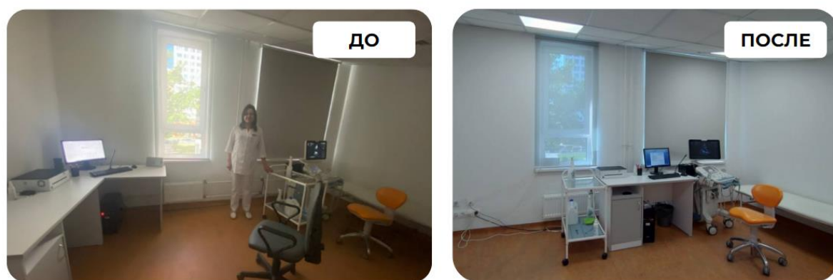
Рисунок 4. Пример кабинета УЗИ до и после внедрения стандарта.

6.1. Формирование медицинской записи с использованием устройства голосового ввода можно осуществлять параллельно с проведением ультразвукового исследования или по завершении исследования, согласно клинической ситуации.