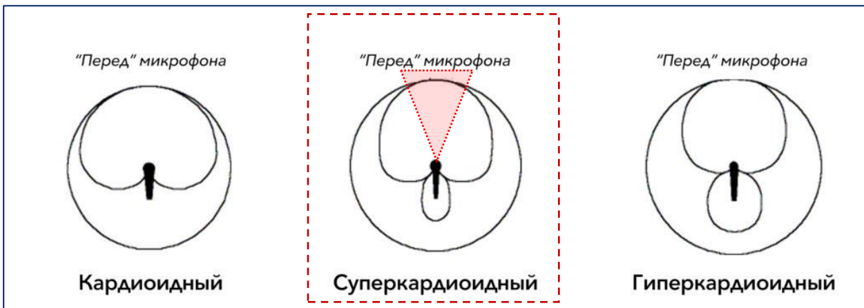
Рисунок 3. Схемы однонаправленных стационарных (проводных) микрофонов — кардиоидный, суперкардиоидный, гиперкардиоидный. В медицинских учреждениях МО используются суперкардиоидные микрофоны.

4. Расположение устройства голосового ввода на рабочем месте по отношению к врачу, с целью более корректного распознавания голосовой речи в текст рекомендуется размещение стационарных (проводных) микрофонов на рабочем месте сотрудника таким образом, чтобы расстояние говорящего до микрофона составляло 15-20 см, при этом сам стационарный микрофон должен быть повернут с сторону говорящего поскольку относится к микрофонам с однонаправленной суперкардиоидный (рис 3). Наилучшее качество записи голоса достигается в секторе 30-40% от передней поверхности микрофона. Уровень чувствительности настраивается индивидуально в зависимости от дикции сотрудника, рекомендуемые значения находятся в пределах 3-7%.