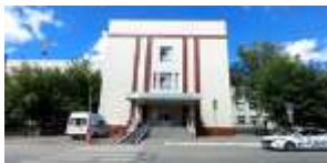
ГБУЗ НСО «НОКГВВ № 3»