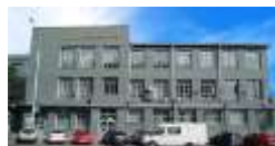
ГАУЗ НСО «ГКП № 1»