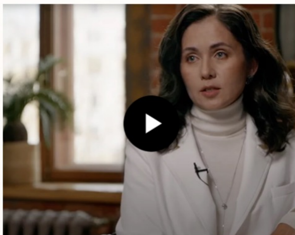
Почему различается стоимость оригинального препарата и дженерика