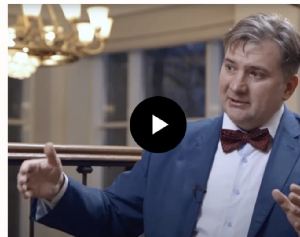
Какие факторы влияют на стоимость препарата

Несколько экспертных мнений с акцентами на разных аспектах.