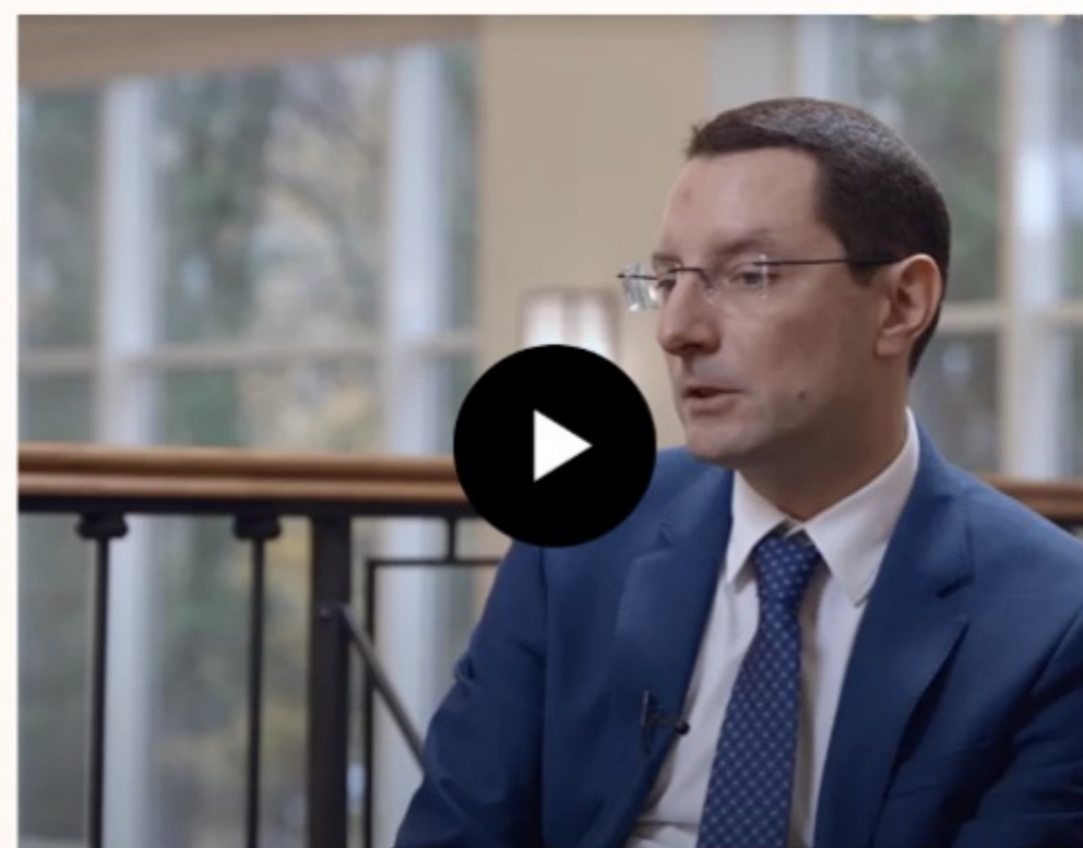
Как регулируется цена на жизненно важные препараты

Заместитель исполнительного директора Национальной ассоциации «АПФ»