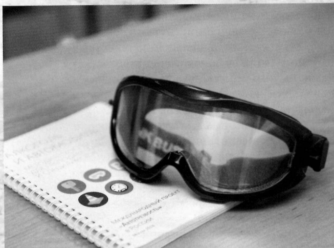
Очки-тренажер «Фатальное зрение»

– внедрение обучающего модуля «Алкоголь и вождение» в курс теоретической подготовки автошкол. Цель обучающего модуля состоит не только в том, чтобы проинформировать будущих водителей о медицинских и юридических последствиях употребления алкоголя, наркотиков и лекарственных средств при управлении транспортным средством, но и объективно продемонстрировать им с помощью очков-тренажеров «Фатальное зрение», как меняется поведение человека под влиянием этих психоактивных веществ.