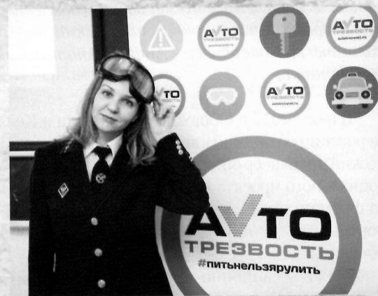
«Автотрезвость» в Кузбассе

В конце февраля 2018 г. проекту «Автотрезвость» было посвящено два важных мероприятия. В Москве состоялся круглый стол, где были подведены итоги работы проекта в ушедшем году и презентованы планы на текущий год. А в Кемерове прошло расширенное заседание комиссии по охране здоровья, экологии и развитию спорта Общественной палаты Кемеровской области. На федеральном уровне было отмечено, что 2017 г. стал для «Автотрезвости» прорывным. К проекту присоединилось восемь городов, общее число регионов-участников достигло 15. Реализация проекта наглядно продемонстрировала, как органы власти, бизнес, государственные учреждения, наука, общественные организации объединяются для борьбы с одним из самых отвратительных проявлений пьянства – пьянством за рулем. Высокую оценку получил и Кемеровский областной клинический наркологический диспансер. Он до сих пор остается единственным медицинским учреждением, взявшим на себя ответственность за внедрение проекта. Без больших бюджетов, без спонсорской помощи, которая была бы очень кстати, на чистом энтузиазме кемеровские наркологи успешно развивают проект «Автотрезвость».