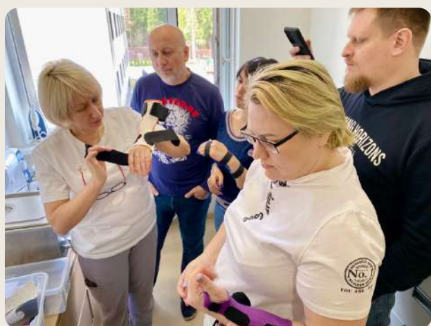
Принципы стажировок Школы «Три сестры» — работа с запросами студентов и упор на практику

Когда клиника накопила большой опыт клинической практики, знаний о ранней реабилитации и обучения сотрудников, стало очевидным, что необходимо делиться этими знаниями с другими специалистами. Так в 2021 году появилась Школа реабилитации «Три сестры». Сейчас туда приезжают учиться реабилитологи и врачи других направлений, специалисты по восстановлению движения, эрготерапевты из разных регионов России и СНГ. Благодаря этому проекту повышается уровень подготовки реабилитологов и повышается осведомленность врачей разных специальностей о реабилитации. К маю 2023 года стажировку в клинике прошли около 150 специалистов и 100 студентов медицинских специальностей.