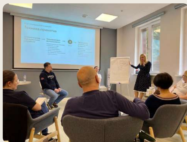
Занятия по навыкам эффективного общения — обязательная часть курсов Школы