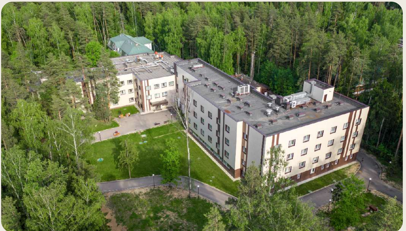
Общий вид клиники «Три сестры»

Клиника «Три сестры» выросла из медицинского стартапа на месте заброшенного пионерского лагеря в Московской области. Сейчас «Три сестры» — это лидер отрасли, крупнейший реабилитационный стационар в Европе (130 мест, 1500 пациентов в год, площадь 6000 кв. м.), который работает по международным стандартам.