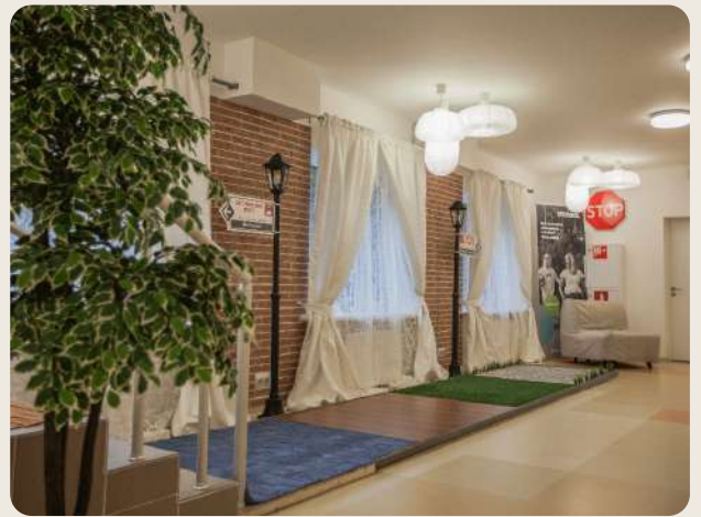
Тренажер Easy street