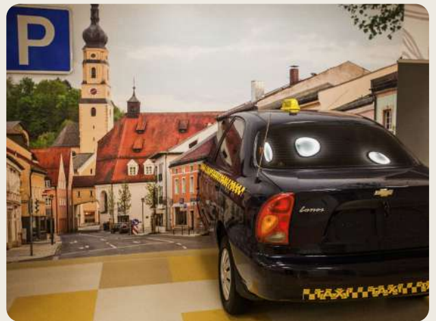
Машина-тренажер для пересаживания